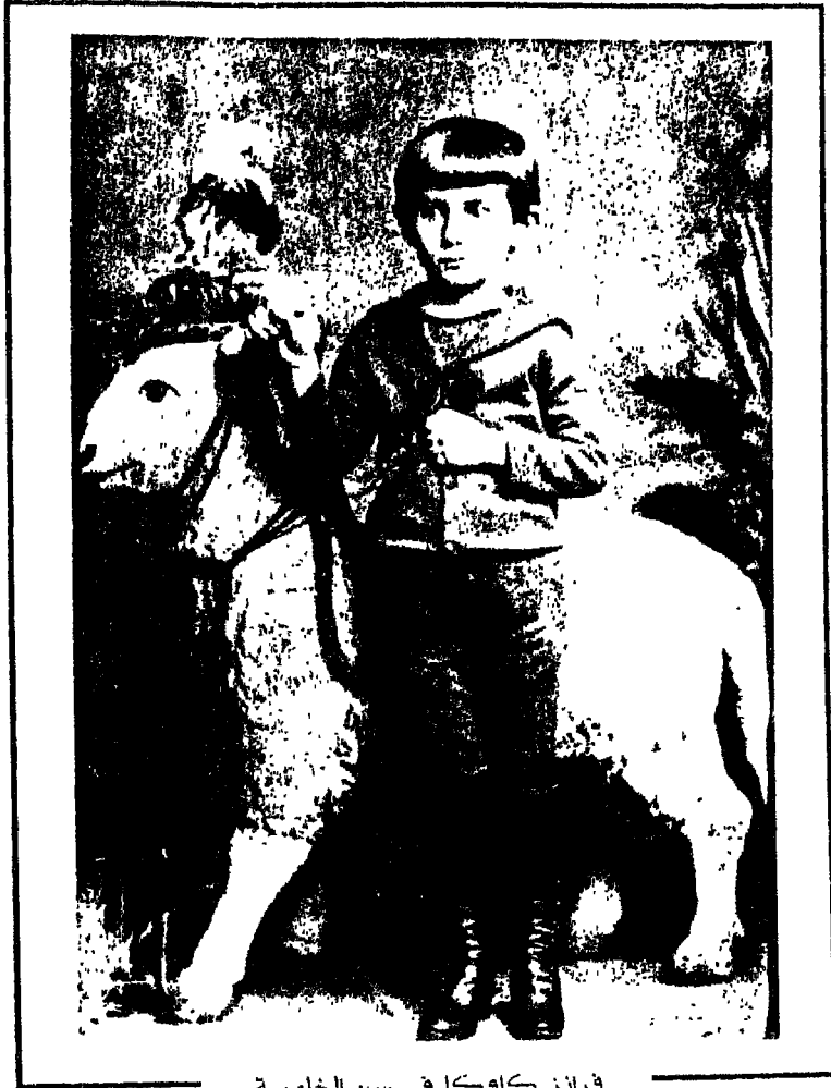
فرانز كافكا في سن الخامسة